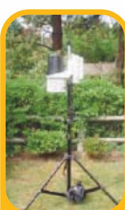
Station météorologique portable (mesure la vitesse et la direction du vent, la température et la pluviométrie)