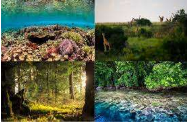
Biodiversité et écosystèmes