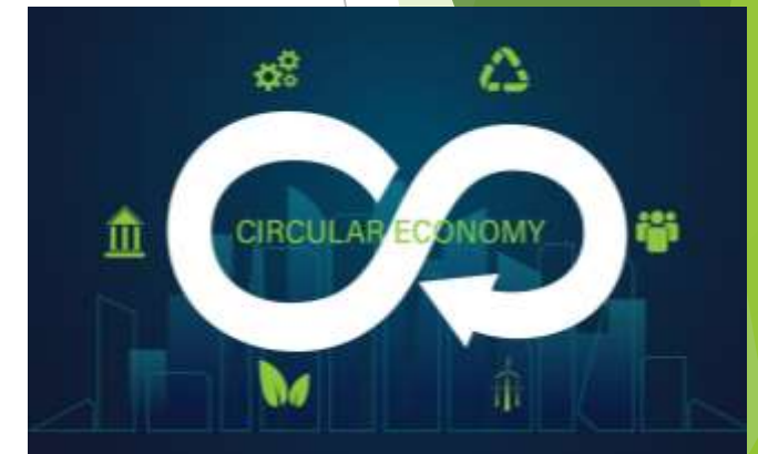
Utilisation des ressources et économie circulaire