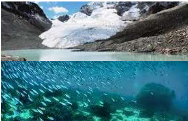
Ressources marines et en eau