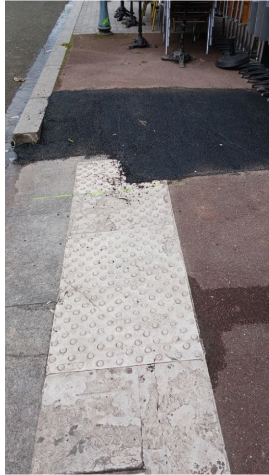
Etat existant versus exemple de modification de la piste cyclable